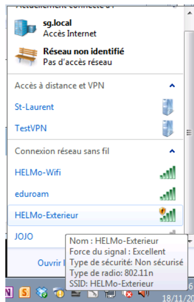
Figure 1 : Liste des réseaux HELMo